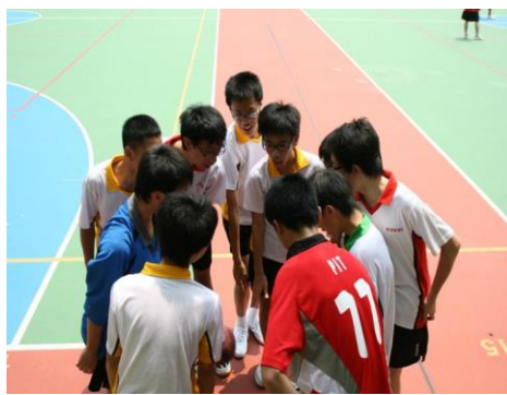
圖 1.2 學生參與聯課活動，有助提升社交能力和人際溝通技巧。