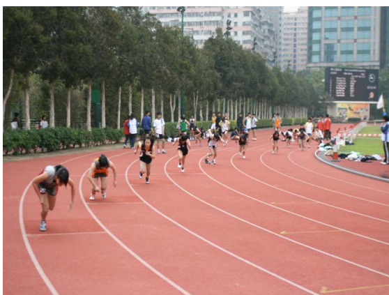
圖1.8 公共運動設施 – 運動場