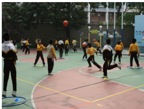
圖 1.1 學生進行體育活動，有助提升協作、創造、解決問題等共通能力。